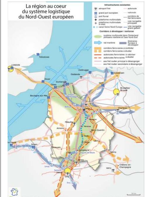
Carte des enjeux logistiques régionaux

La délégation générale au développement de l'axe Nord rattachée au CCILAN et placée auprès du préfet de région, pour rendre opérationnelles les décisions du conseil